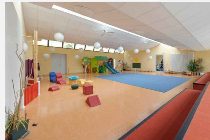
Kita „Stepping Stones“