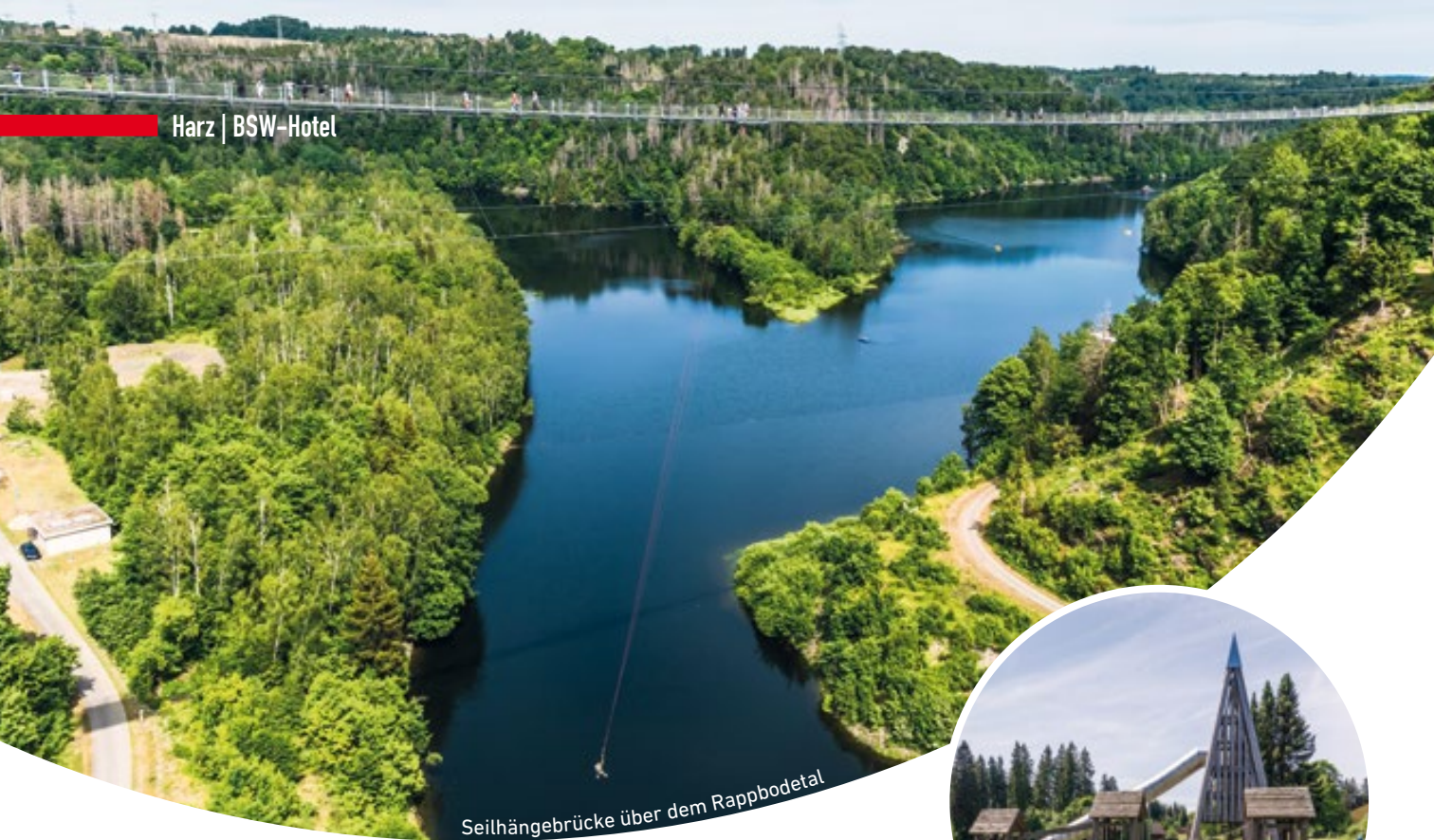
Seilhängebrücke über dem Rappbodetal