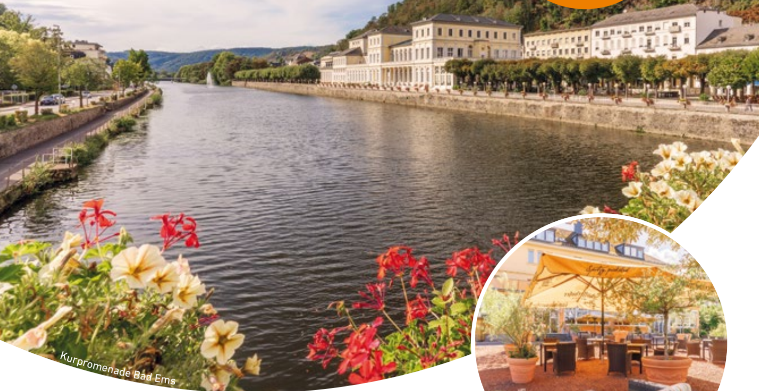
Kurpromenade Bad Ems